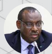
Hon. Claver Gatete