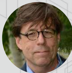
Moderator/Modérateur: Benjamin Gianni