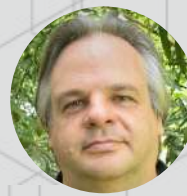
Moderator/Modérateur: Olivier Dehoorne