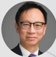
Hon. Yuen Pau Woo